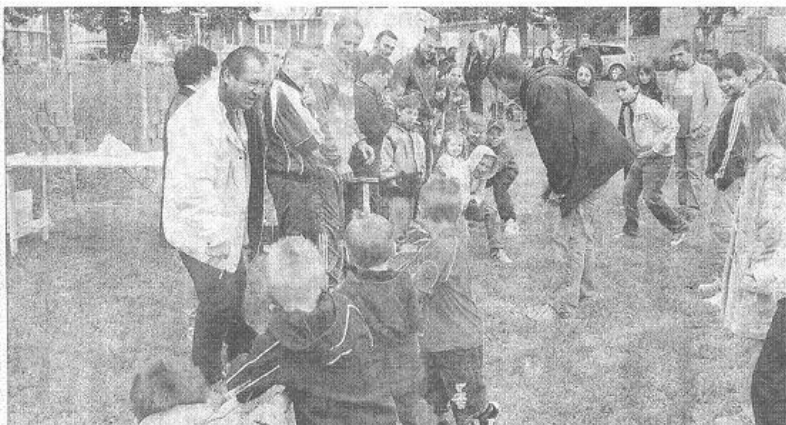
Les jeux picards et les autres ont connu du succès avec les enfants laférois.

Internet : http://club-animation-laferois.wifeo.com